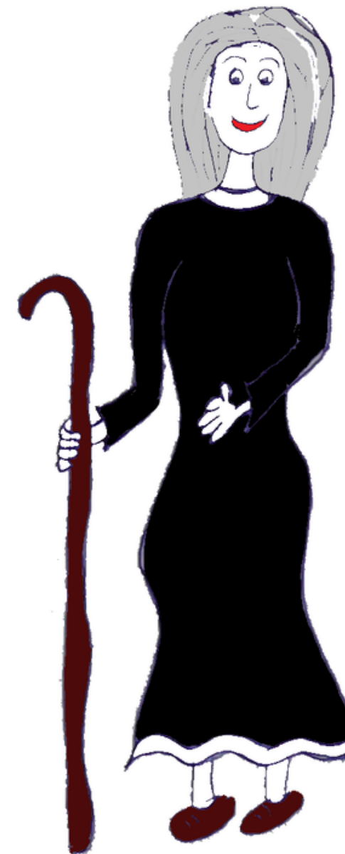
Die Alte Weise